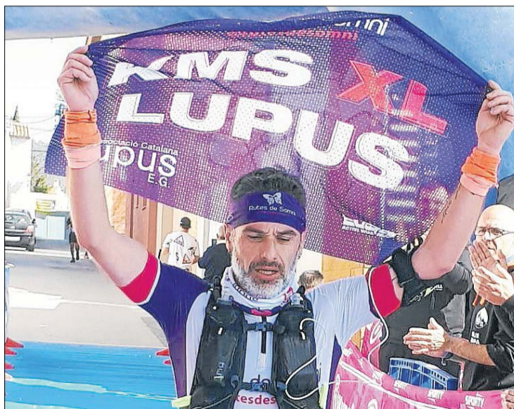
Al llegar a la meta siempre muestra una bandera con su reto.

Ha tardado 22 años en poder cumplir este proyecto solidario. "La muerte de mi madre me creó un trauma tan grande que han tenido que pasar muchos años para hacer realidad lo que me prometí en su día. Tengo la esperanza de que un día se averigüen las causas de la enfermedad y que haya curación", concluye.